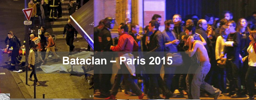
Bataclan – Paris 2015