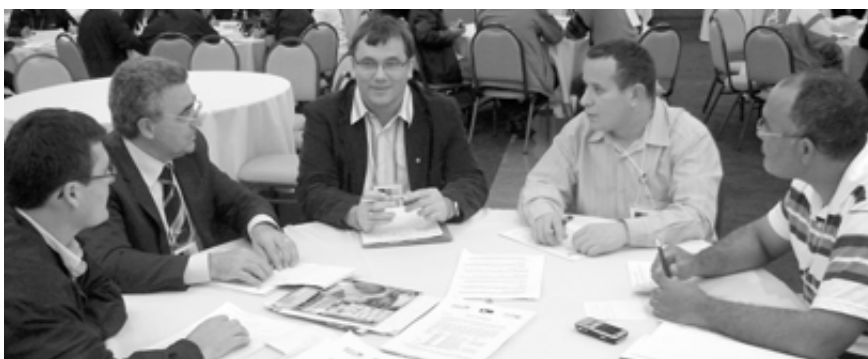
In Arbeitsgruppen wurden Netzwerke auf Unternehmensebene neu geknüpft und verstärkt.

Die Autorin ist freie Mitarbeiterin des DGB Bildungswerk.