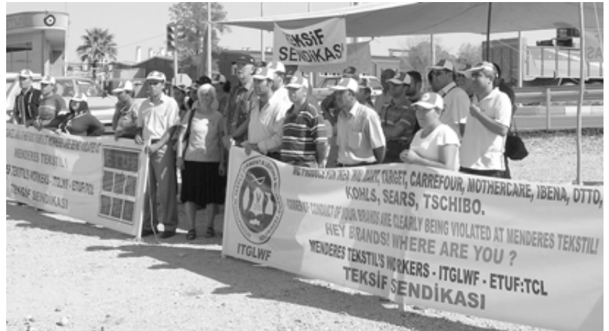
Mitglieder der Gewerkschaft TEKSIF demonstrieren vor der Fabrik Menderes Tekstil.