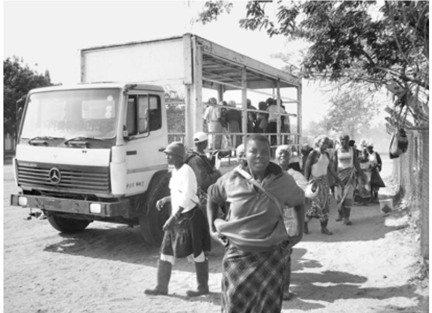
Auf dem Weg zur Arbeit im Zuckerfeld: Arbeiterinnen der Zuckerfarm Maragra

Die Maragra Zuckerfarm gehört der südafrikanischen Firma Illovo Sugar Limited. Sie beschäftigt mehr als 4.000 Arbeiter auf dem Feld und in der Fabrik. Es ist eines von vier großen kommerziellen Zuckergütern in Mosambik; zusammen beschäf-